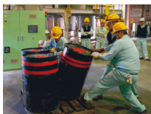
危険体感教育(新潟工場)

安全に対する基本的な考え方、化学物質の安全な取り扱いなど業務に必要な安全衛生知識について、教育を実施するとともに、業務上必要な資格の取得推進を図っています。また、万一の火災、漏洩および自然災害などに備え、防災訓練・教育を実施し、緊急事態に備えています。さらにこれまでの安全衛生教育に加え、実際の危険を疑似体験する「危険体感教育」を実施し、危険感受性の向上を図っています。