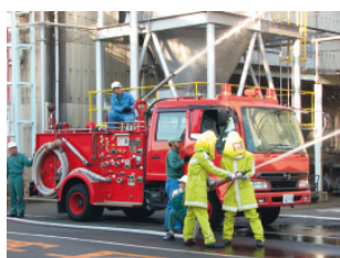
防災訓練(岡山工場)