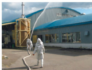
防災訓練(北海道工場)