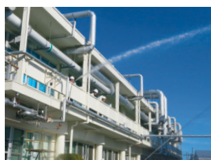
防災訓練(開発研究所)