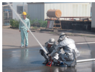
防災訓練(新潟工場)