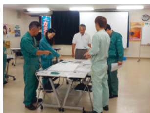
危険予知訓練(KYT)(岡山工場)