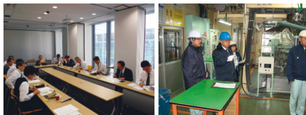
レスポンシブル・ケア委員会(本社) ISO9001維持審査風景(北海道工場)

当社では、工場、研究所およびグループ会社を対象に、本社環境安全部によるRC内部監査を定期的を実施しています。監査における指摘事項については、各事業所において、計画的に改善を行っています。