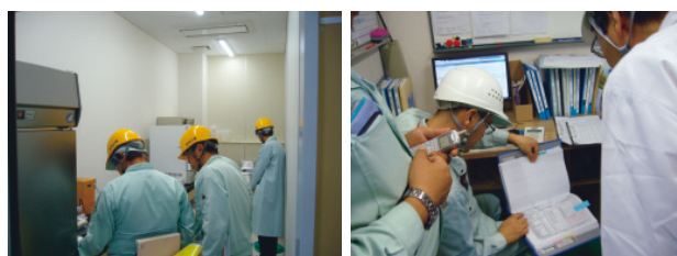
RC内部監査風景(新潟工場)