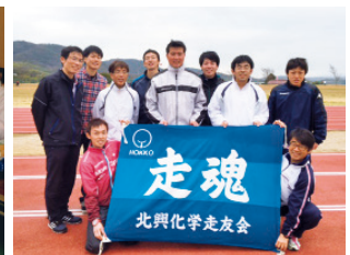
地域の駅伝大会への参加(岡山工場)