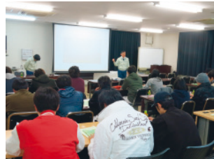
大学生の研修の受け入れ (開発研究所)