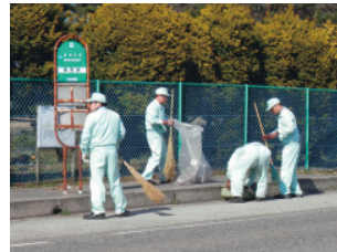
工場周辺の清掃活動(新潟工場)