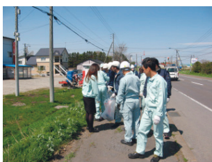
工場周辺の清掃活動(北海道工場)

新潟工場では、1961年の操業開始以来、周辺地域には残り少なくなった昔からの松林の保全と新松の育成、および敷地内に多く残る自然樹林の保護など、緑化を計画的に推進しています。工場内には桜の木も多く、春には地域の方々などをお招きして観桜会を開催しています。