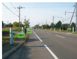
交通安全運動への協力(北海道工場)