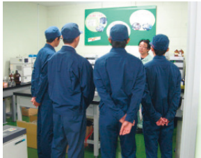
インターンシップの受け入れ (北海道工場)

各事業所では、見学や小中高大学生の体験教育・研修を受け入れています。工場では、製品の製造工程や安全衛生および環境保全の取り組みについて説明を行っています。研究所では、農薬の開発において必要な様々な効果試験や安全性試験について説明を行っています。