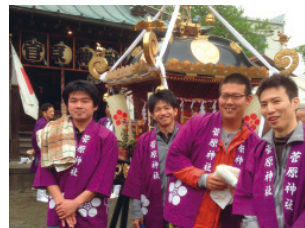
地域のお祭りへの参加(開発研究所)

新潟工場では、新潟北地区の日本化学工業協会加入企業と共同で、「地域対話」を継続的に開催し、地区の行政や住民の方々との意見交換、相互理解を図っています。