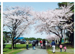
工場内の桜(新潟工場)