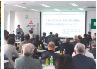
新潟北地区地域対話 (三菱ガス化学(株)において開催)