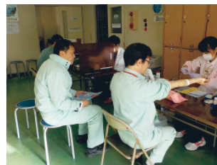
献血活動への協力(岡山工場)