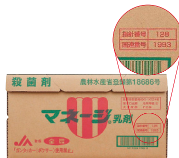
容器イエローカード(段ボール箱記載例)