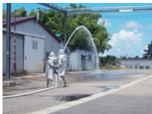
防災訓練(新潟工場)

安全に対する基本的な考え方、化学物質の安全な取り扱いなど業務に必要な安全衛生知識について、教育を実施するとともに、業務上必要な資格の取得推進を図っています。また、万一の火災、化学物質の漏えいおよび自然災害などに備え、防災訓練・教育を実施し、緊急事態に備えています。さらにこれまでの安全衛生教育に加え、実際の危険を疑似体験する「危険体感教育」を実施し、危険感受性の向上を図っています。