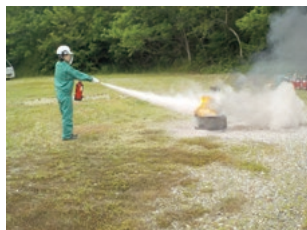
防災訓練(岡山工場)