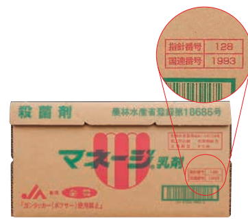
容器イエローカード(段ボール箱記載例)