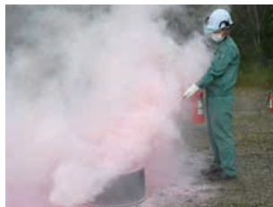
防災訓練(岡山工場)