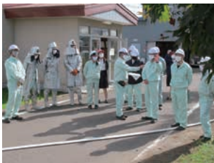
防災訓練(北海道工場)

安全に対する基本的な考え方、化学物質の安全な取り扱いなど業務に必要な安全衛生知識について、教育を実施するとともに、業務上必要な資格の取得推進を図っています。また、万一の火災、化学物質の漏えいおよび自然災害などに備え、防災訓練・教育を実施し、緊急事態に備えています。さらにこれまでの安全衛生教育に加え、実際の危険を疑似体験する「危険体感教育」を実施し、危険感受性の向上を図っています。