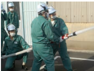
防災訓練(岡山工場)