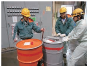
危険体感教育(新潟工場)