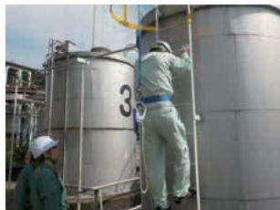
危険体感教育(岡山工場)