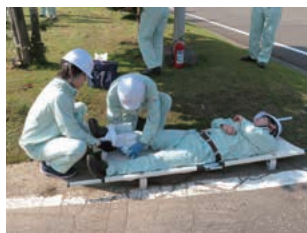
防災訓練(北海道工場)