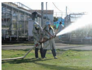
防災訓練(開発研究所)

安全に対する基本的な考え方、化学物質の安全な取り扱いなど業務に必要な安全衛生知識について、教育を実施するとともに、業務上必要な資格の取得推進を図っています。また、万一の火災、化学物質の漏えいおよび自然災害などに備え、防災訓練・教育を実施し、緊急事態に備えています。さらにこれまでの安全衛生教育に加え、実際の危険を疑似体験する「危険体感教育」を実施し、危険感受性の向上を図っています。