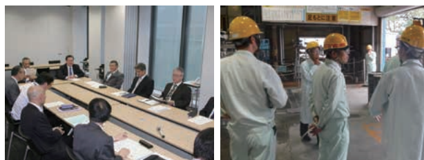
レスポンシブル・ケア委員会(本社) RC内部監査風景(新潟工場)

当社では、工場、研究所およびグループ会社を対象に、本社企画部環境安全チームによるRC内部監査を定期的実施しています。監査における指摘事項については、各事業所において、計画的に改善を行っています。