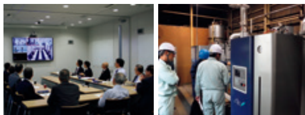
レスポンスブル・ケア委員会(本社) RC内部監査風景(北海道工場)

レスポンスブル・ケア委員会では、当社の環境・安全・健康に関する基本方針、目標、計画について協議しています。各事業所、グループ会社においては、各事業内容に合った体制を整備し、RC活動を推進しています。