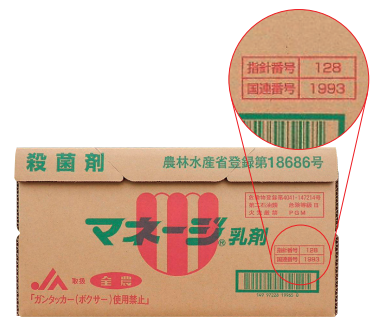
容器イエローカード(段ボール箱記載例)