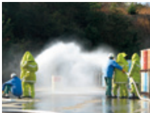
防災訓練(岡山工場)