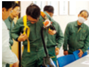
保護具着用講習(岡山工場)