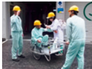
防災訓練(新潟工場)