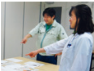
危険予知訓練(KYT)(研究所)

安全に対する基本的な考え方、化学物質の安全な取り扱いなど業務に必要な安全衛生知識について、教育を実施するとともに、業務上必要な資格の取得推進を図っています。また、万一の火災、化学物質の漏えいおよび自然災害などに備え、防災訓練・教育を実施し、緊急事態に備えています。さらにこれまでの安全衛生教育に加え、実際の危険を疑似体験する「危険体感教育」を実施し、危険感受性の向上を図っています。