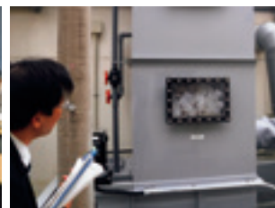
レスポンシブル・ケア委員会(本社) RC内部監査風景(研究所)